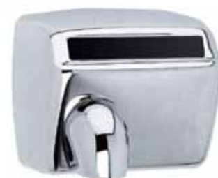
SECADORES Y MÁS